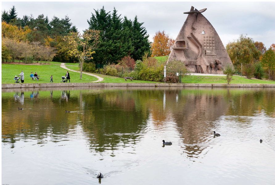
La dame du Lac