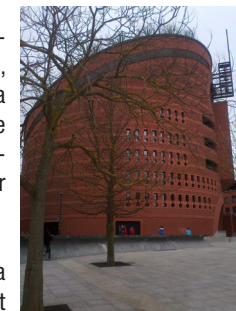
La cathédrale d'Evry

6 Franchir le passage à niveau à gauche, et tourner à droite pour gagner la gare de Ballancourt. 7